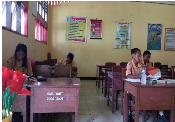
Gambar 1. Kurang Aktif Kehadiran

Dalam penelitian ini penulis menemukan beberapa masalah. Seperti siswa yang kurang aktif kehadiran disekolah, kurang disiplin waktu, dan kurang mentaati kerapian berpakaian.