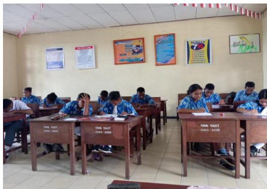
Gambar 3. kurangnya kerapian berpakaian