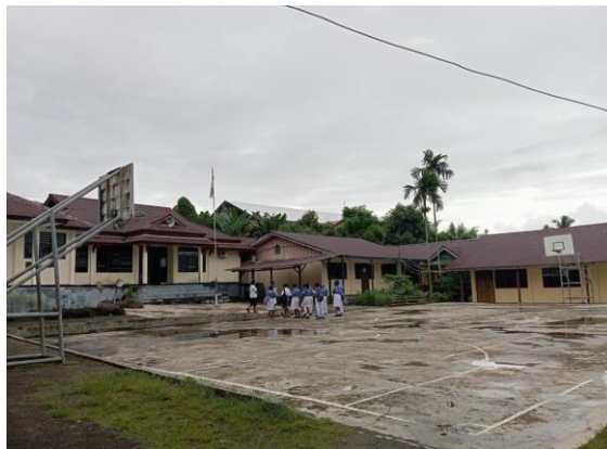
Gambar 2. Kurang Disiplin Waktu