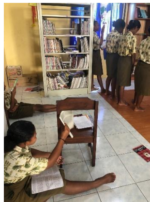
Gambar 5. Kondisi perpustakaan