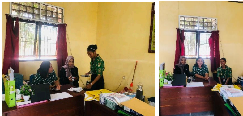
Proses wawancara bersama guru pamong

Proses wawancara dilakukan oleh peneliti dengan memberikan beberapa pertanyaan kepada narasumber untuk mendapatkan sebuah informasi sesuai dengan judul yang diangkat. Pada penulisan ini, penulis melakukan wawancara melalui beberapa narasumber yang melibatkan siswa SMP Villanova, Guru pamong, Kepala sekolah, dan beberapa guru aktif di sekolah tersebut.