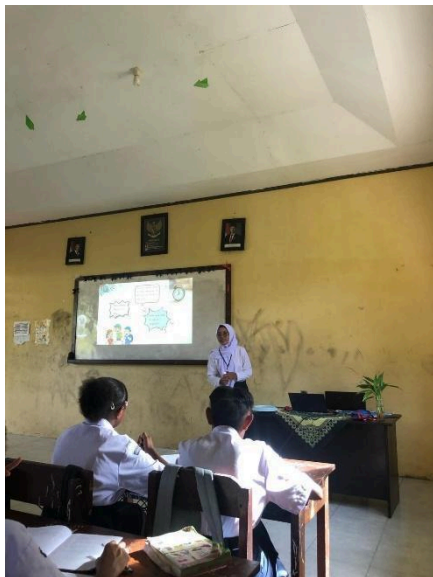
Gambar 1. Proses pembelajaran di kelas

Berdasarkan hasil observasi, siswa lebih banyak termotivasi belajar ketika guru menggunakan metode pembelajaran interaktif, seperti diskusi kelompok, permainan edukatif, dan sesi tanya jawab dalam meningkatkan pola pikir kritis pada siswa.