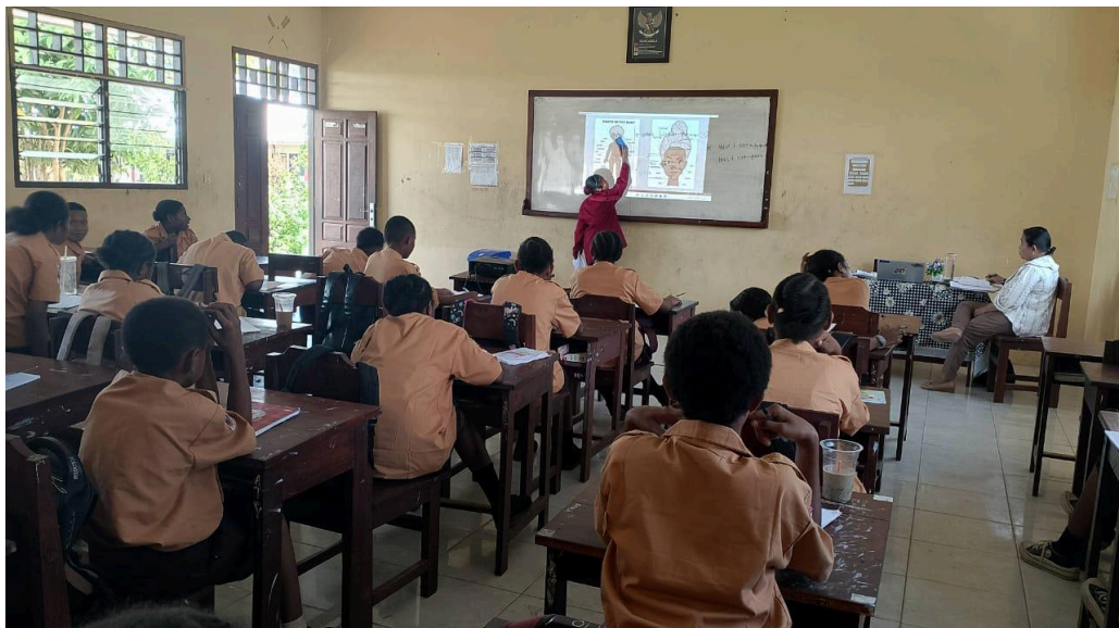
Proses pembelajaran menggunakan ppt dan ilustrasi gambar

Berdasarkan observasi lapangan, hampir semua siswa mengaku lebih tertarik belajar jika pembelajaran menggunakan teknologi. Hal ini dibuktikan dengan wawancara bersama guru, penyusunan mata pelajaran melalui power point (ppt) yang disiapkan oleh guru dengan gambar atau animasi, video pembelajaran berisikan quiz, penggunaan souns system dalam praktek olahraga, dan lain sebagainya.