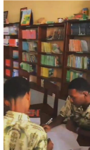
Gambar 2. Siswa belajar di