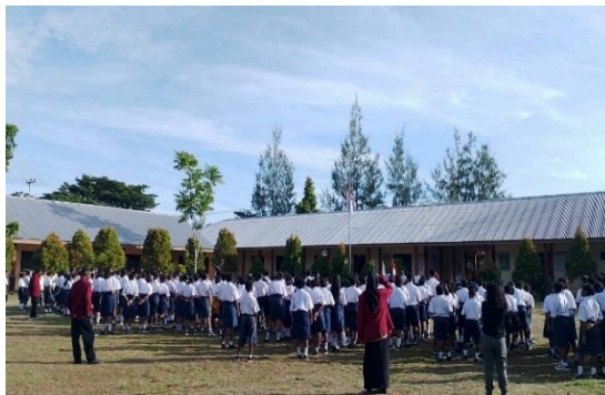
Gambar 3. Prosesi apel pagi dan upacara bendera