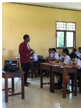
Gambar 1. Guru Menyampaikan materi pembelajaran

Berdasarkan wawancara bersama guru, guru menyatakan bahwa siswa lebih tertarik pada guru yang menyampaikan materi dengan cara menarik dan memberikan kesempatan diskusi meningkatkan minat mereka.