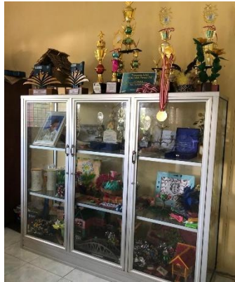
Beberapa piala dan karya tangan peserta didik