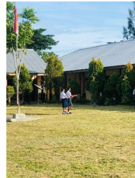
Gambar 4. Prosesi pengibaran