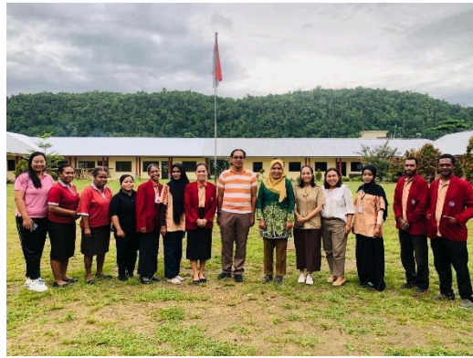
Gambar 3. Observasi bersama para guru

Berdasarkan penelitian yang telah dilakukan, ternyata peran guru dalam meningkatkan motivasi belajar sangat berpengaruh. Guru yang menjelaskan materi dengan menarik, 80% siswa di kelas memperhatikan guru dan 15% dari mereka mengobrol, dan 5% lainnya mengantuk. Selain menjelaskan materi yang menarik, guru juga hendaknya memperhatikan kesehatan fisik, karena jiwa yang sehat akan memberikan energi positive dan easy-going agar siswa juga tertarik mengikuti mata pelajaran karena jiwa positive itu menular pada orang sekitar. Selain itu, guru juga perlu memperhatikan penampilan mereka, sebagaimana sebuah pepatah “penampilan adalah sebagian dari adab/tatakrama”, hendaknya guru berpakaian sopan dan rapi agar nyaman dilihat.