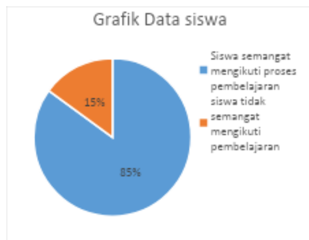
Gambar 2. Grafik data siswa