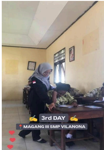
Gambar 1. Kondisi kelas perpustakaan